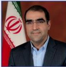
وزیر بهداشت، درمان و آموزش پزشکی دکتر سید حسن قاضی زاده هاشمی