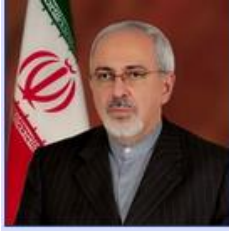
وزیر امور خارجه دکتر محمد جواد ظریف