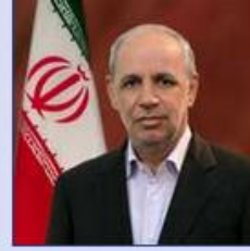
معاون رئیس جمهور و رئیس سازمان اداری و استخدامی کشور جمشید انصاری