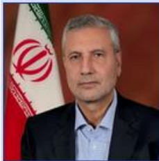
وزیر تعاون، کار و رفاه اجتماعی دکتر علی ربیعی