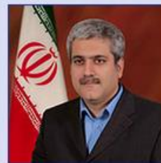
معاون علمی و فناوری رئیس جمهور دکتر سورنا ستاری