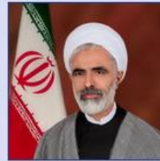
معاون حقوقی رئیس جمهور حجت الاسلام والمسلمین مجید انصاری