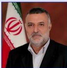
وزیر جهاد کشاورزی مهندس محمود حجتی